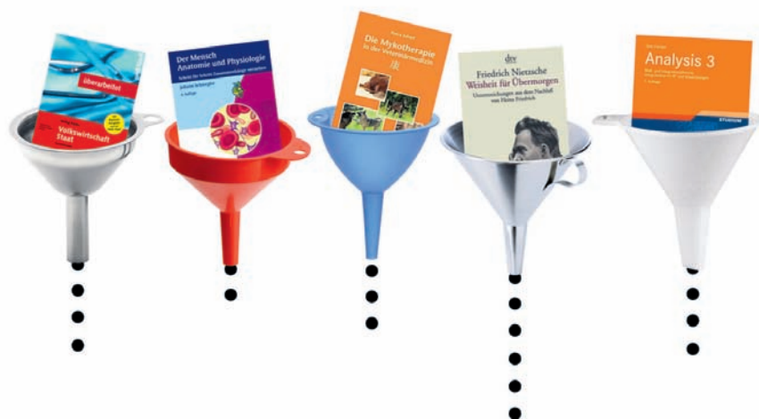
Das Punkte-Aufwand-Verhältnis: Kein einheitliches Mass.