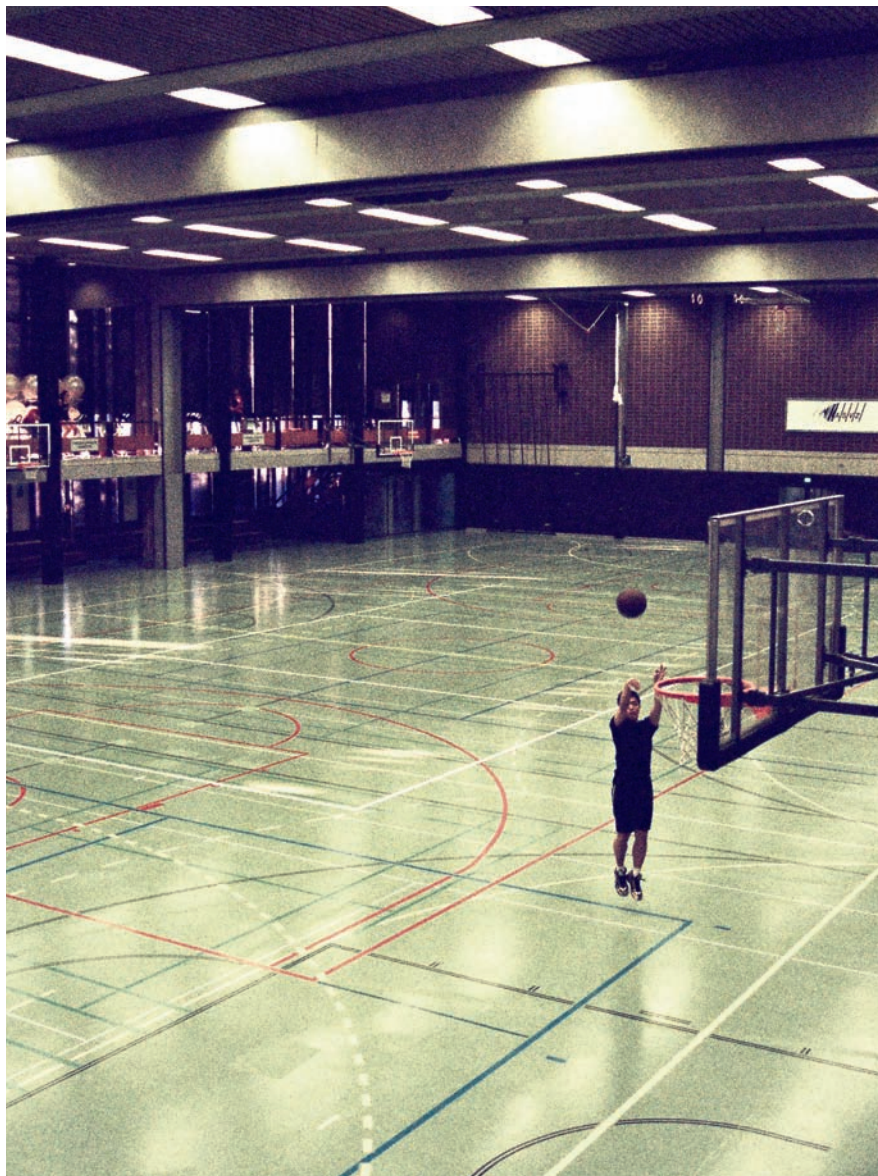
Stell dir vor, es ist Sport und niemand geht hin.