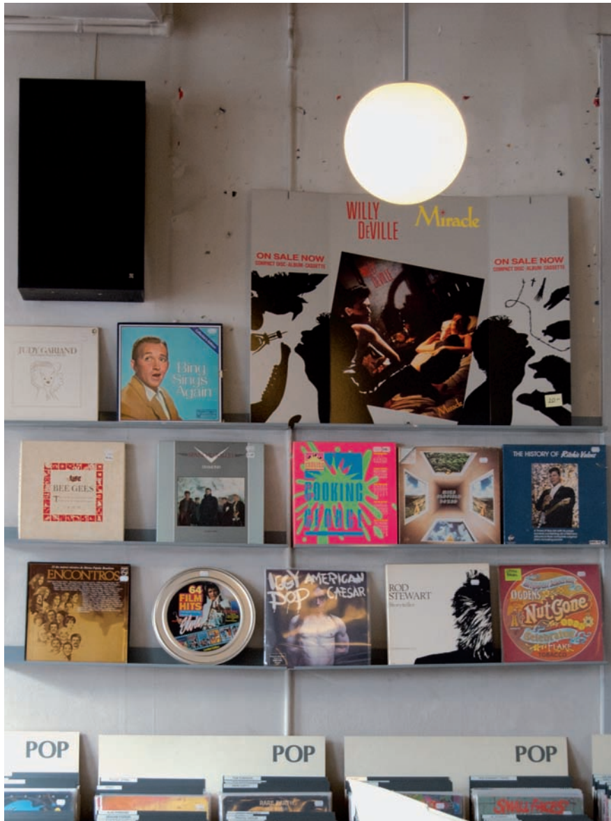
So aufgeräumt sieht es nicht in allen Läden aus.