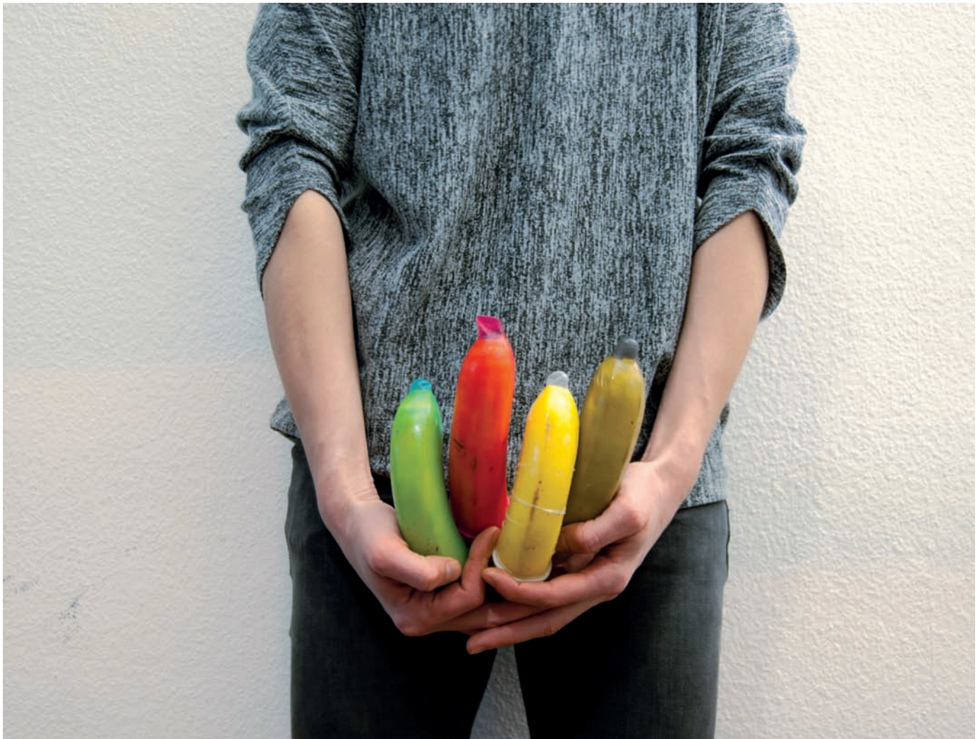
Im Namen der Aufklärung: Im Minimum ein Gummi drum.