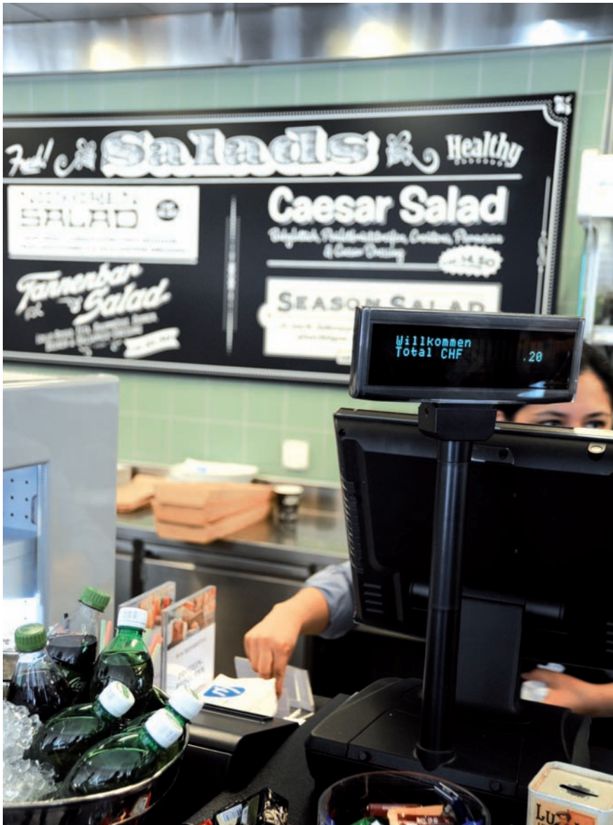
Kalt, modern und teuer. Das ist die neue Tannenbar.