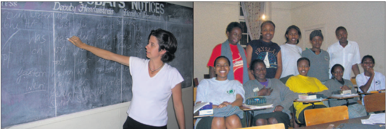
Während einer Deutschstunde (links) und Gruppenbild einer Französischklasse (rechts). Abends müssen keine Uniformen getragen werden.

Wohl gibt es hier – wenn auch wenige – Fussgängerstreifen und Lichtsignale. Doch sind Regeln ja bekanntlich dazu da, um gebrochen zu werden. Und warum sollte frau auch stoppen, bloss weil eine Fussgängerin die Strasse überquert? Die kann dem Auto ja keinen Schaden zufügen. So wartet frau gut und gerne mal zehn Minuten am Rand einer Strasse, bis der