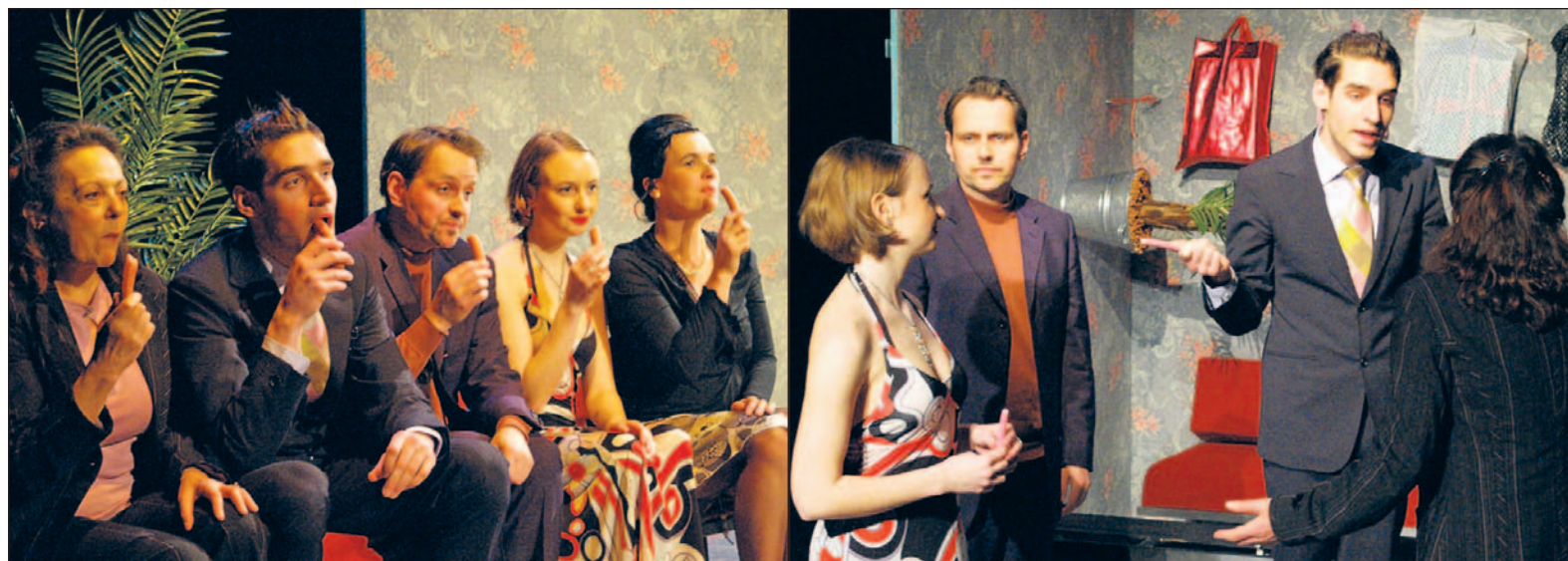
Ein stetes Erproben der banalen Sprache und dem Sprechen – Schäri, Schtei, Papier.

Zur Geschichte, dem roten Faden (der ebenfalls seinen metaphorischen Auftritt hat), welcher eine Geburtstagsfeier ist, findet man nur sporadisch zurück. Wichtiger sind die