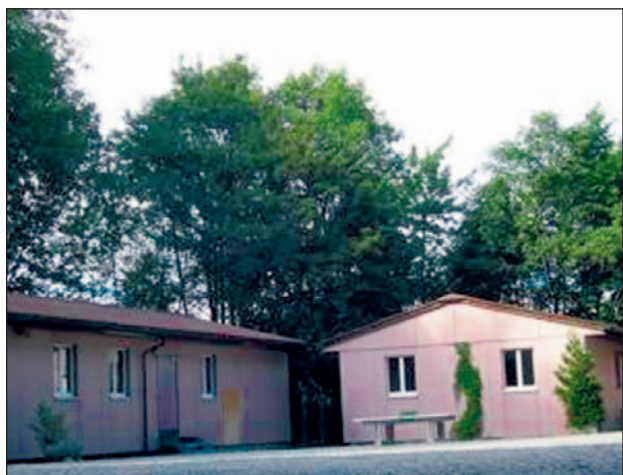
Die besetzten Gebäude der autonomen Schule.

Für weitere Infos: www.denk-mal.info/wiki