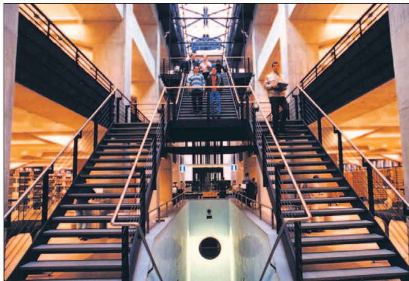
Die Kantons-, Stadt- und Universitätsbibliothek: ZBZ