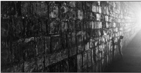
The Wall: It was only a fantasy...