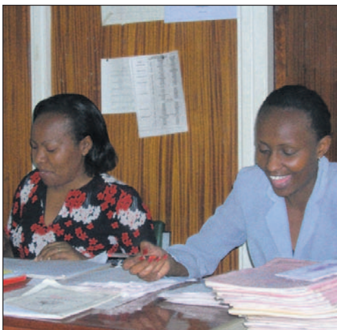
Zwei Lehrerinnen bei der Arbeit

Doch alles ist relativ. Neulich stand ich von Kopf bis Fuss eingeseift in der Wanne, als das Wasser aus dem Hahn langsam zu einem Rinnsal wurde, nur um schlussendlich ganz zu versiegen. Seither betrachte ich auch meine kalte Eimerdusche als Himmel auf Erden, vor allem weil sie mich nicht mitten im Duschprozess im Stich lässt.