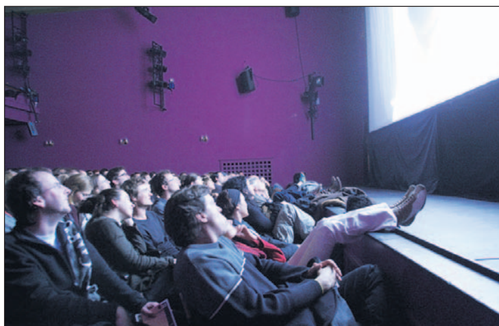
Mach's dir gemütlich: Vorführungsraum im Casinothater.

internationalen Wettbewerb nominiert. Dennoch hat es welche drunter, deren Selektion für einen Laien unverständlich scheint: Was zum Beispiel soll «Don Kishot Be'Yerusha-