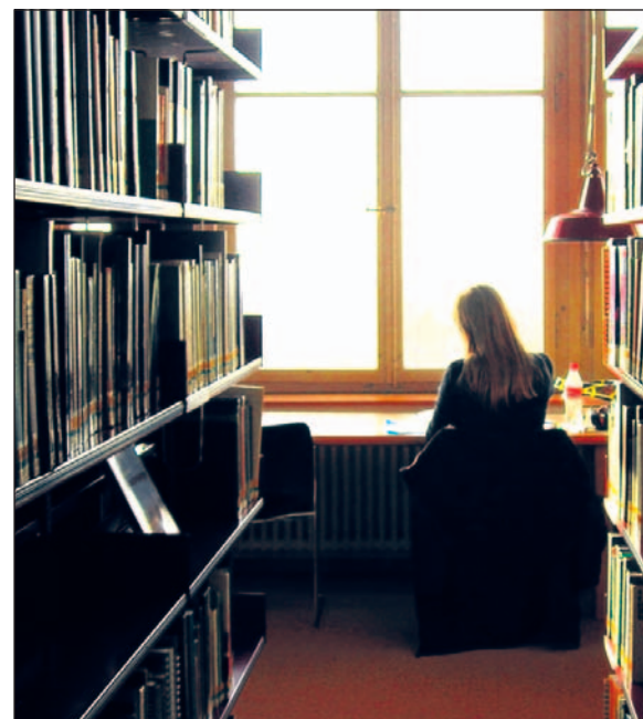
Die Bibliothek als Lernort. Arbeitsplätze sind immer knappe

angesprochen. Angesichts des öffentlichen Charakters und unterschiedlicher geographischer Zentralität ein kaum lösbares Problem. Gibt es dennoch Möglichkeiten, diesen Tendenzen entgegen zu wirken?