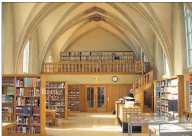
Die Musikalienabteilung der ZB im Predigerchor.

Jede öffentlich zugängliche Bibliothek hat natürlich ihre speziellen Benutzer, auch wir. Es kommt halt auch auf die Lage drauf an. Wir haben im Moment einen Benutzer – und zwar seit Jahren – von dem wir fast überzeugt sind, dass er nachts im Wald lebt, und den Tag über bei uns in der Bibliothek. Wir können es zwar nicht belegen, aber der Eindruck hat sich schon über die Jahre gefestigt, in denen er mit dem Rucksack in die Bibliothek kommt und in der ASVZ-Garderobe duscht.