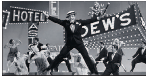
Singin' in the Rain: What a glorious feeling