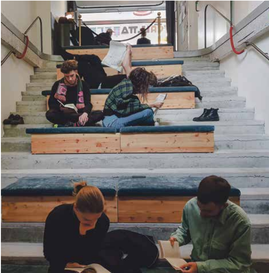
So ruhig geht es an einem Reading Rave zu und her.

muss man sich, leicht träge von der beruhigenden Stille, erst wieder an den anbrechenden Lärm gewöhnen. Anschliessend setzen sich einige der Gäste zusammen und kommen bei einem Bier ins Gespräch.