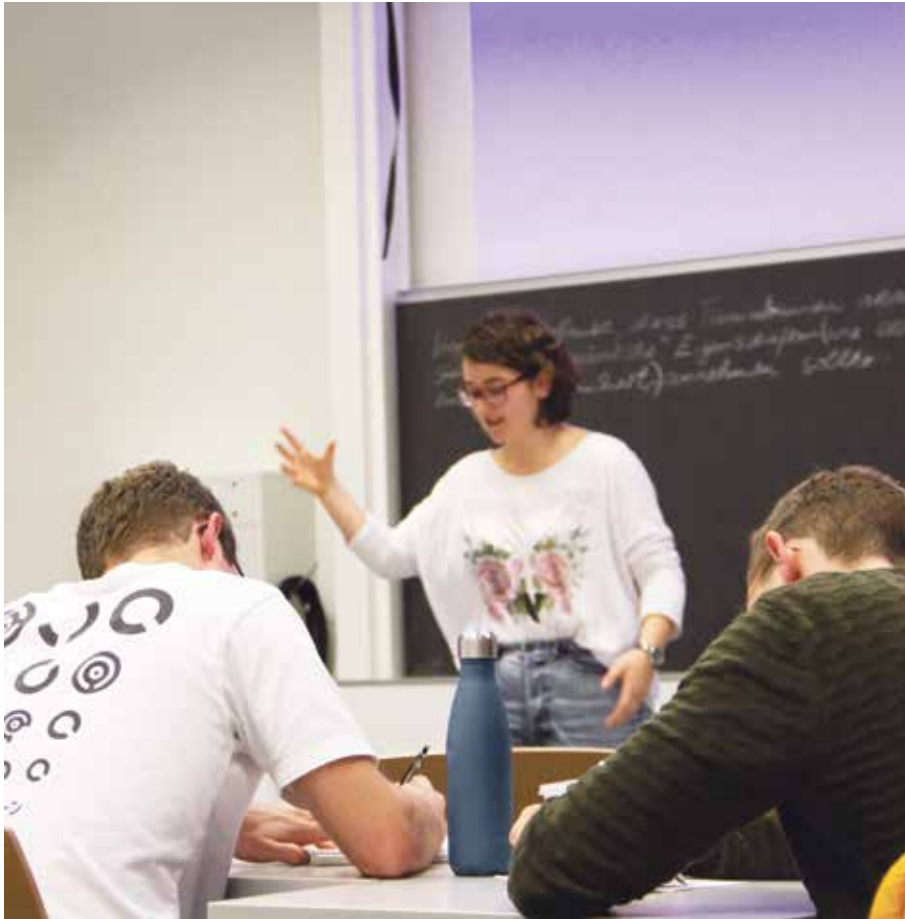
Nach sieben Minuten Redezeit gibt die Jury (vorne) eine detaillierte Rückmeldung.