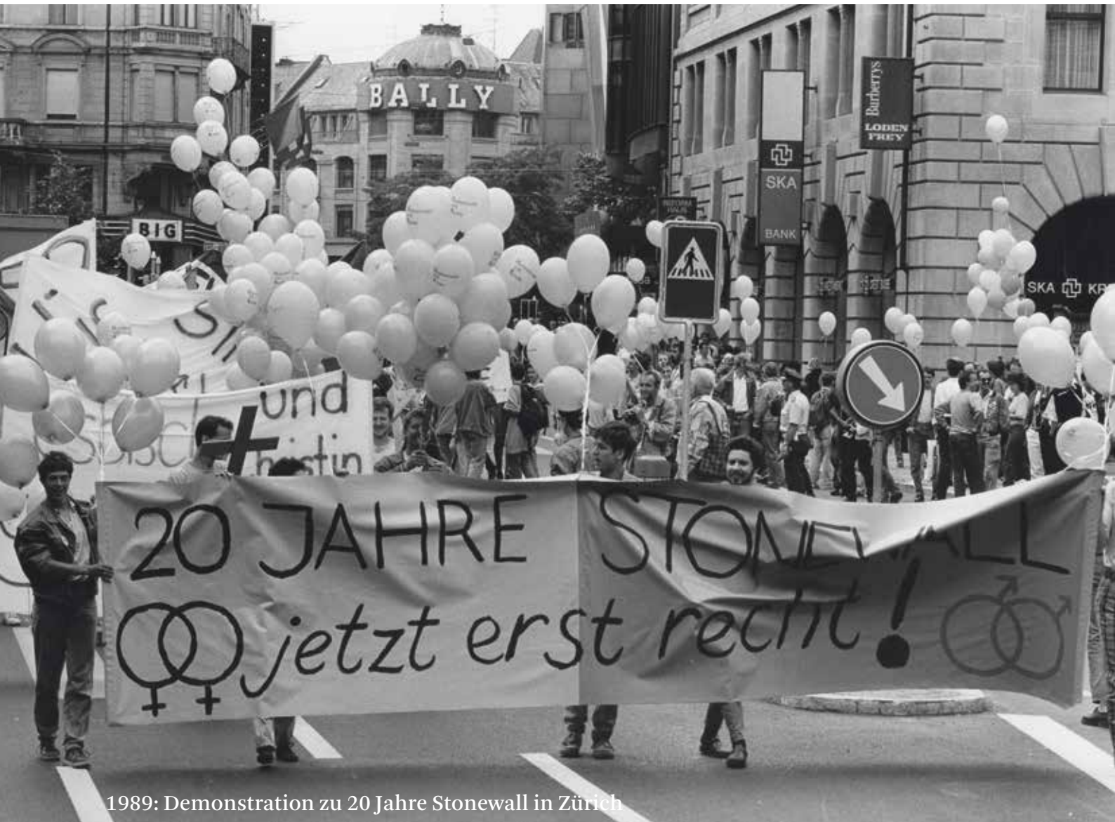
1989: Demonstration zu 20 Jahre Stonewall in Zürich

Die LGBTIQ*-Community war schon immer von Studierenden geprägt.