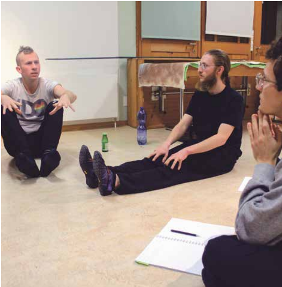
Die Theatergruppe findet das aktuelle Theaterangebot in Zürich «zu bourgeois».