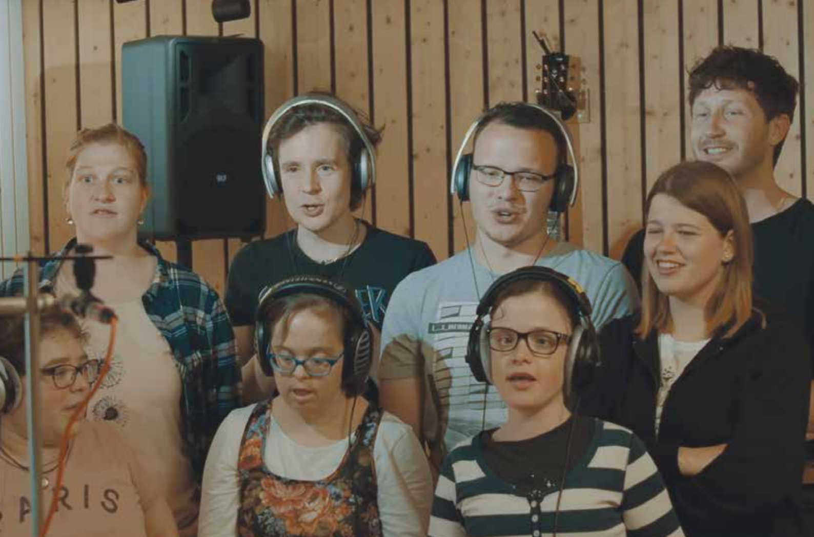
Gemeinsam im Studio den Song «Same as you» aufzunehmen, bereitete allen Freude.

Gabe, die Umstände, wie sie sind, zu akzeptieren und diese nicht die ganze Zeit zu hinterfragen. «Sie machen das Beste aus dem Leben und jedem Moment – das ist etwas, was man ihnen gerne abschauen möchte.»