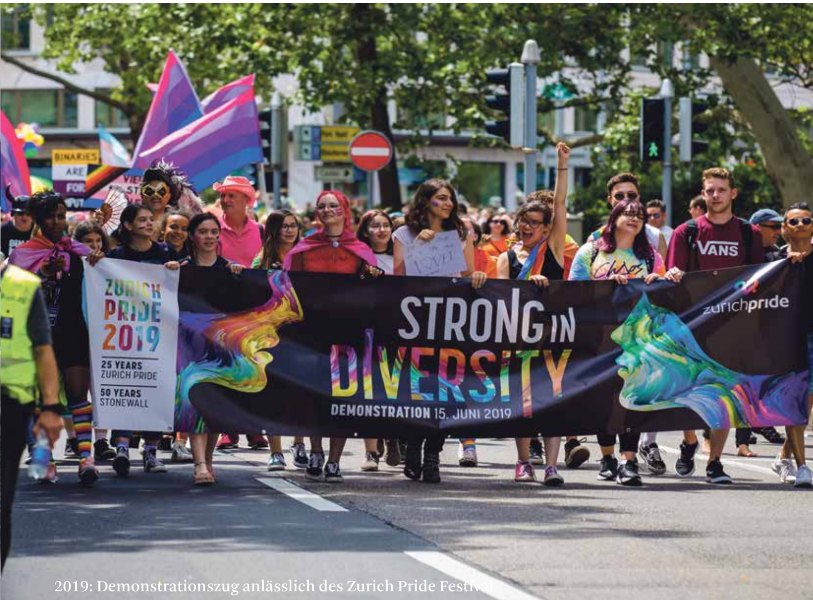
2019: Demonstrationzug anlässlich des Zurich Pride Festival