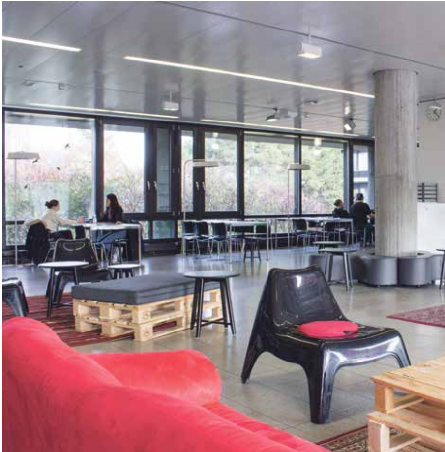
Das «VSUZH Stübli» mit seinem Industrie-Look hätte viel Platz zu bieten.