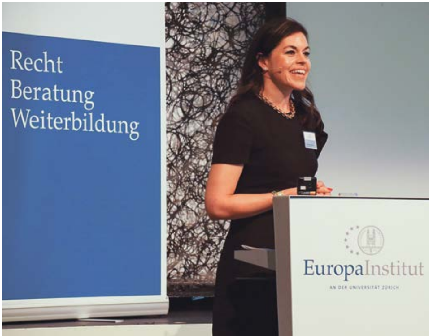
Weiterbildungskonferenz für Jurist*innen: eine Referentin im Lake Side Zürich.

Das Europa Institut (EIZ) wurde 1992 aus privater Initiative als Kompetenzzentrum für Schweiz-Europa-Beziehungen ins Leben gerufen. Im selben Jahr lehnten die Schweizer Stimmberechtigten hauchdünn einen Beitritt der Schweiz zum