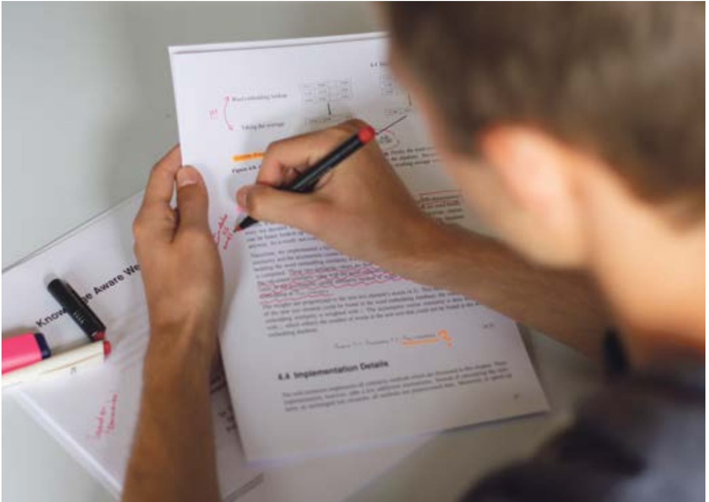
Trotz fehlerhafter Publikationen: Peer-Reviews sind ein Siegel für hohe wissenschaftliche Qualität.