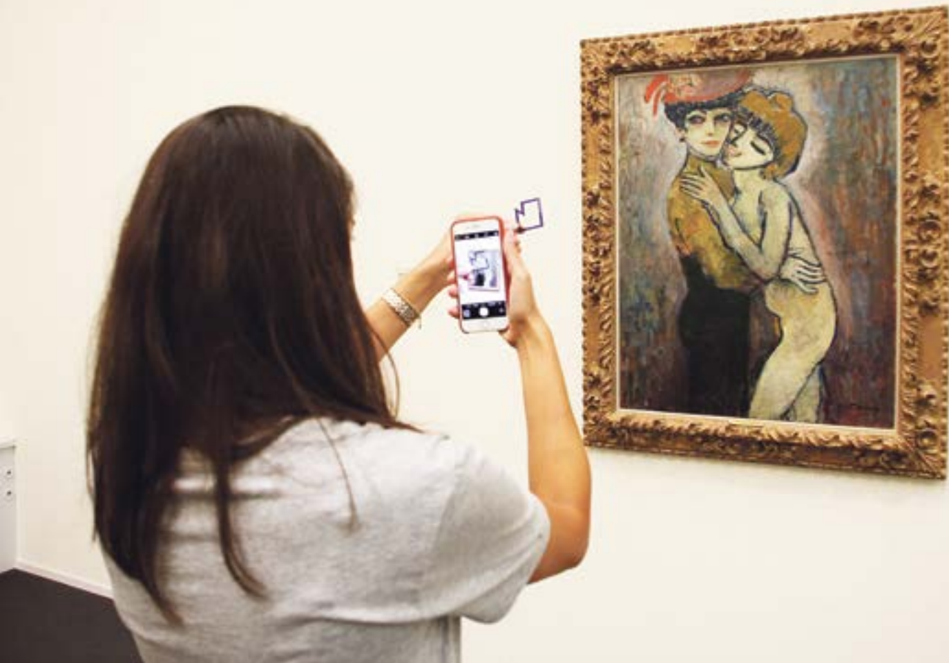
Ein Bestandteil der Museumstour: Teilnehmende sollen ungewöhnliche Details fotografieren.

ist, und diesem die Sammlungen schmackhaft machen. «Jahreszahlen und harte Fakten wird man wenig zu hören bekommen, dafür spannende Details, die die Tourguides selbst interessieren», so Eggli. Denn diese seien keine studierten Kunsthistoriker oder Museumskuratorinnen, sondern selbst deklarierte Fans von spezifischen Museen.