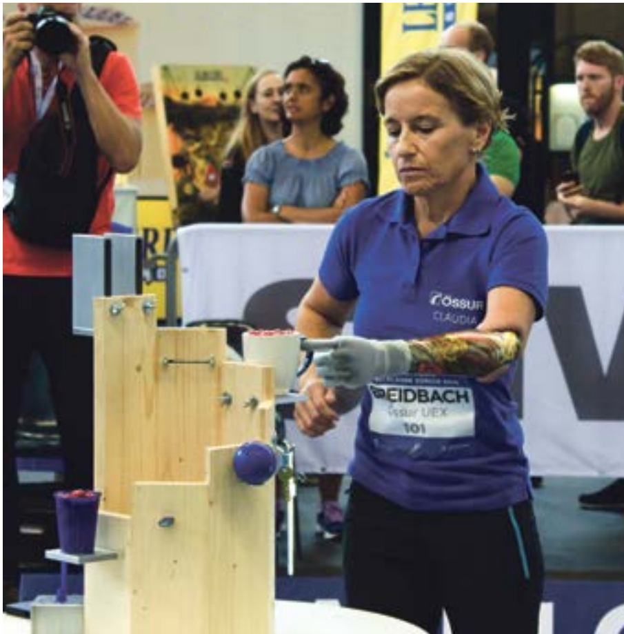
Menschen mit Behinderung zeigen, was ihre Prothesen können.