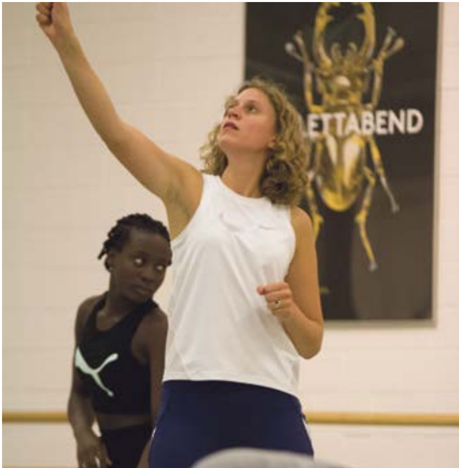
Experimentieren mit Bewegung: Teilnehmerinnen am Open Space Tanz.