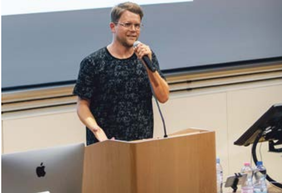
Rapper Knackeboul hält die Laudatio am Big Brother Award.