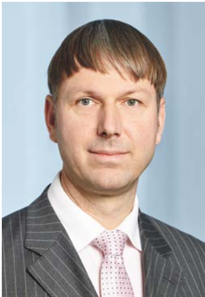
Dirk Helbing forscht zur digitalen Transformation.