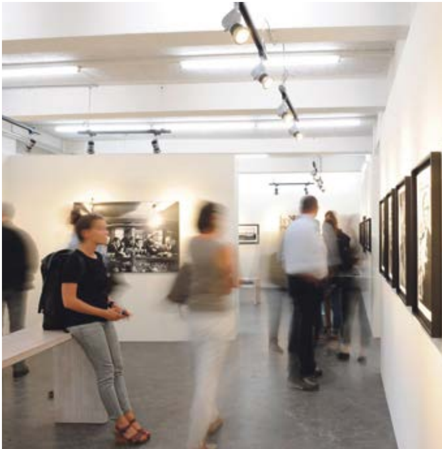
Nur noch bis Ende Juni: Ausstellungsbesuch in der Photobastei.