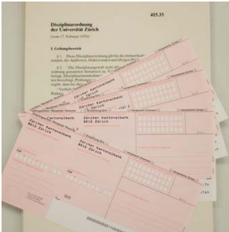
Die revidierte Disziplinarordnung würde Geldstrafen vorsehen.