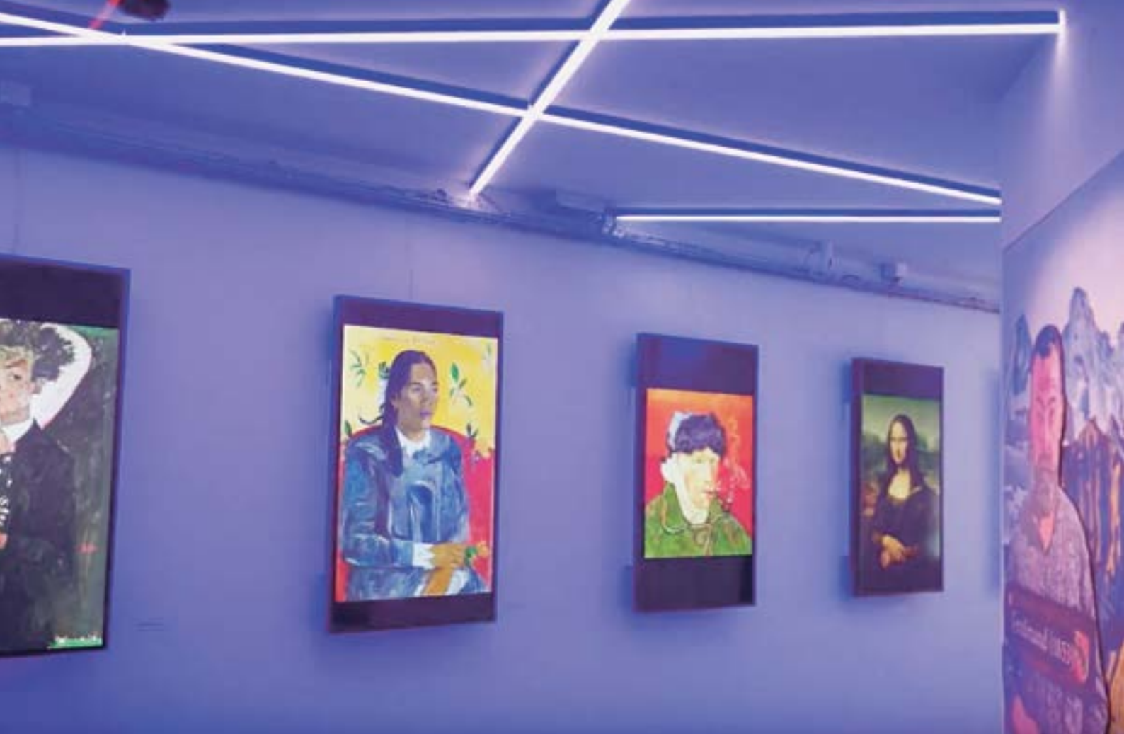
Hinter den Bildern im Escape-Room verstecken sich komplizierte Rätsel.

denkönnen», ist Zeier überzeugt. «Unser Escape-Room soll das unbewusste Lernen und das Lernen über Interaktion und Erfahrung fördern.»