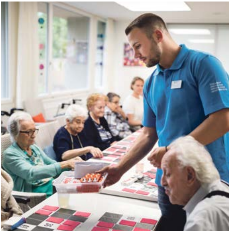
Ob Landschaftsschutz oder Pflege: Zivis übernehmen verschiedenste Aufgaben.