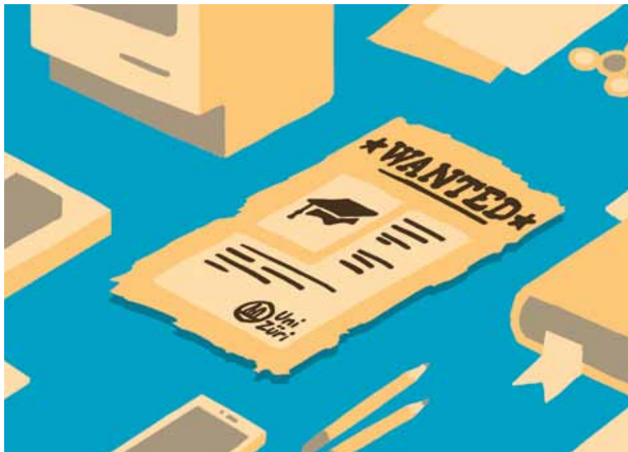
Werden sorgfältig ausgesucht: Ordinarien.