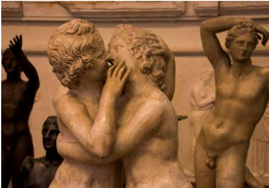
Aufregender, als man denkt: die Archäologie.

Lara Tschanz (Text)