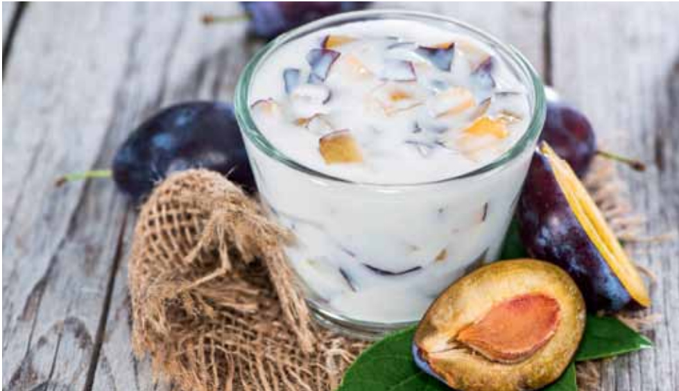
Milchprodukte haben vielseitige gesundheitsfördernde Wirkungen.