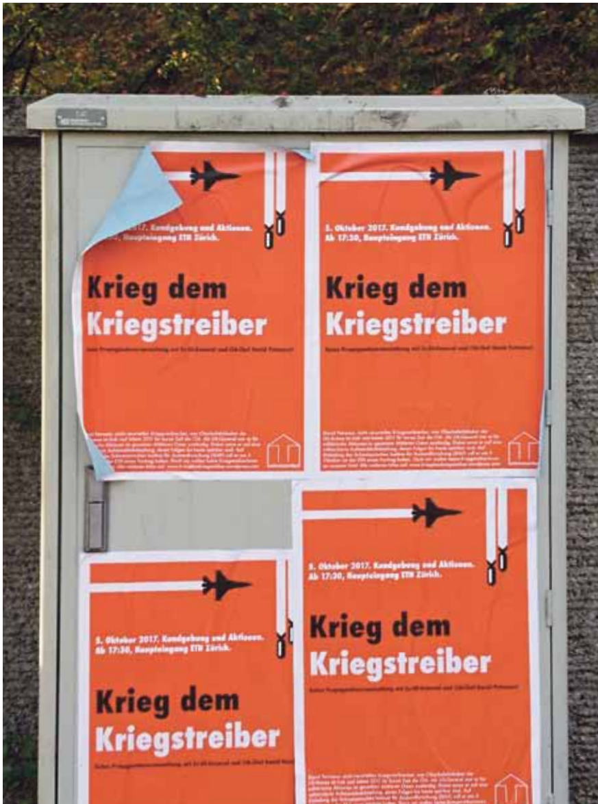
Studierendenprotest: Plakate gegen den Vortrag von Ex-General Petraeus