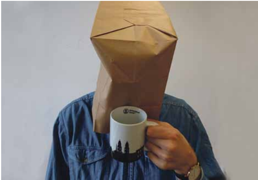
An den «Brown Bag Lunches» zeigt sich, wer Karriere machen will.

Emika Märki (Text)