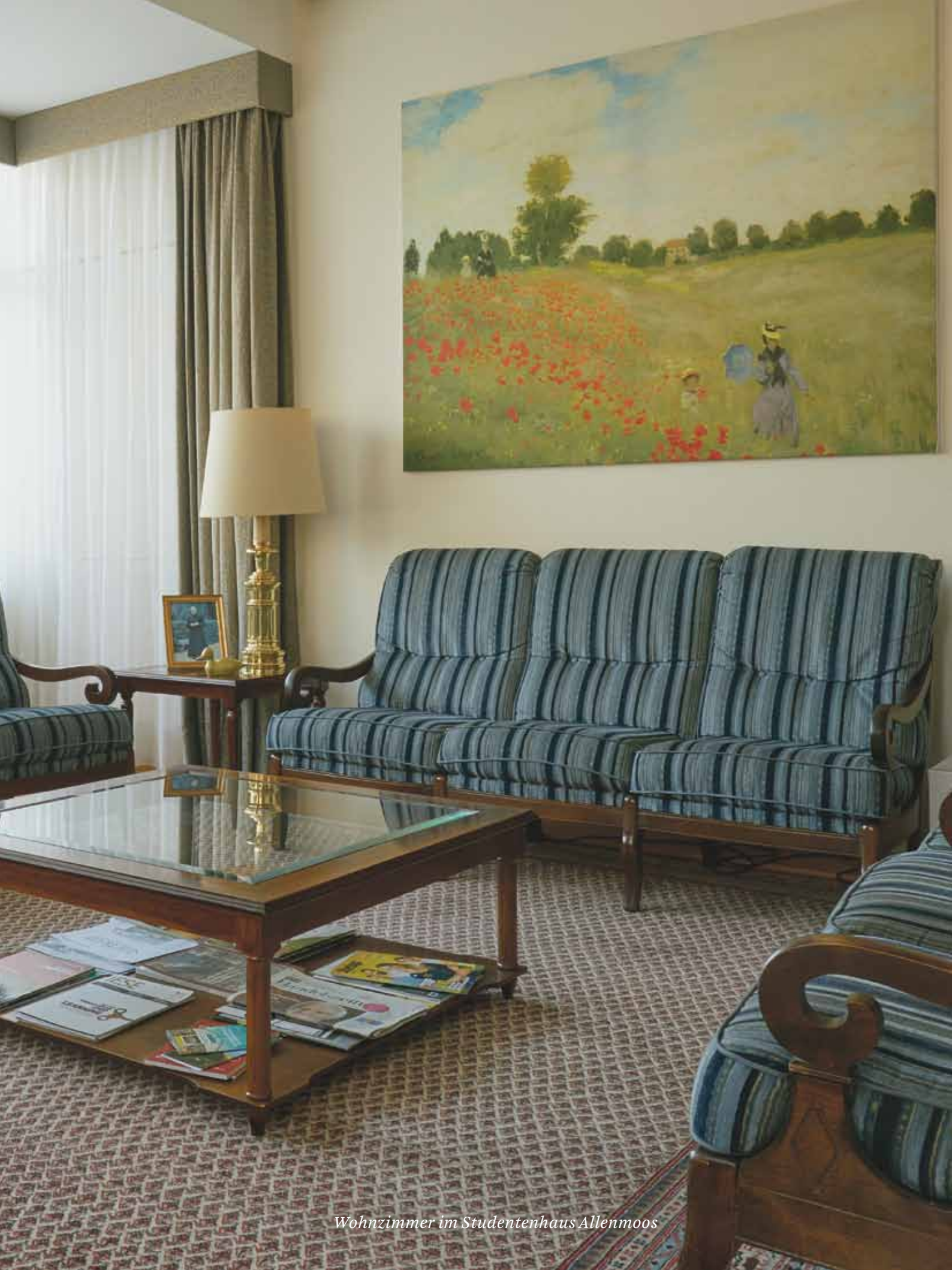
Wohnzimmer im Studentenhaus Allenmoos