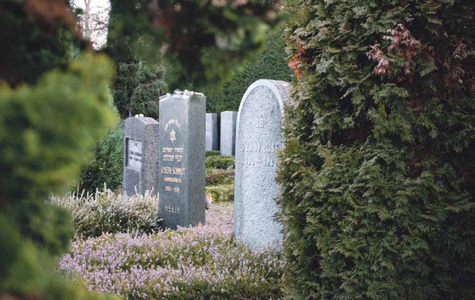
Auf dem israelitischen Friedhof in Wiedikon ruht Joseph Schmidt neben anderen Opfern des Nationalsozialismus.

nichtig erklärt. Und noch im selben Jahr verlässt Schmidt Deutschland. Bis 1940 konzertiert Schmidt in zahlreichen Ländern und Städten. Doch die Lage wird für ihn als Jude in Europa immer gefährlicher. Seine geplante Überfahrt nach Kuba wird im November 1941 wegen der Kriegserklärung Deutschlands und Italiens an die Vereinigten Staaten abgesagt.