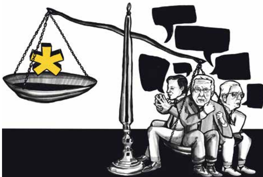
Kleines Zeichen, grosse Empörung: Die Debatte um den Genderstern wiegt schwer.