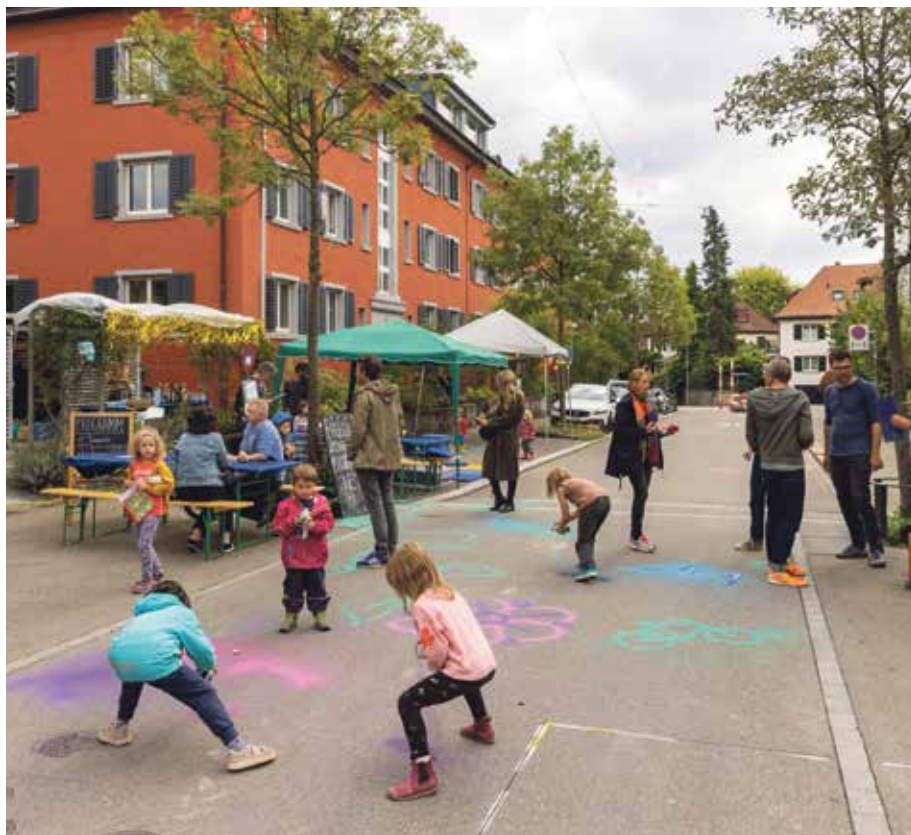
Die Klimagruppe Oberstrass setzt mit den «Parking Days» auf lokalen Aktivismus.