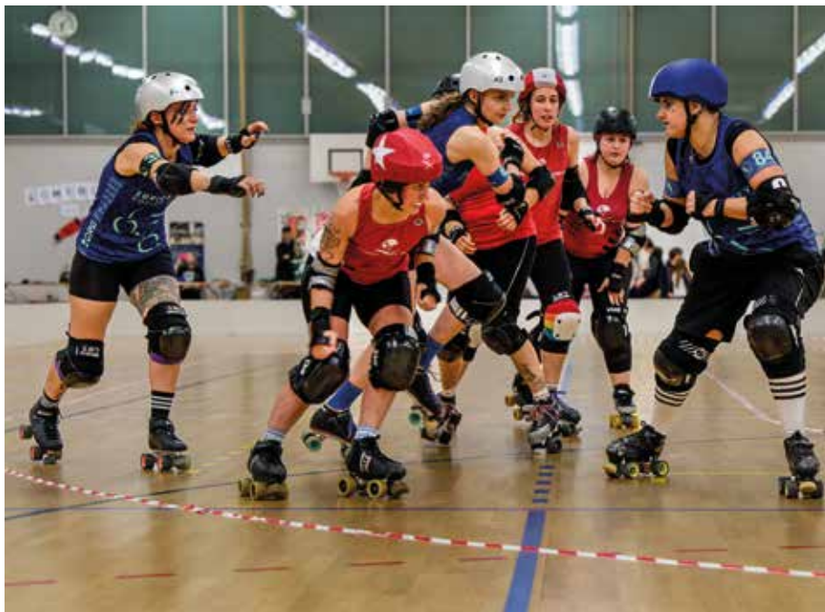
Zusammenstösse gehören dazu: Die Spieler*innen von «Zürich City Roller Derby».

2001 brachte eine Frauengruppe aus Texas Roller Derby zurück und verpasste ihm ein entschieden feministisches Makeover. Das zeigt auch das Gender Statement der internationalen Women's Flat Track Derby Association. Es dürfen alle mitspielen, egal ob trans oder intergeschlechtlich, cis oder non-binär. Wer Roller Derby spielen will, braucht vor allem Mut. Blaue Flecken gehören dazu und werden liebevoll als «Derby Kisses» bezeichnet. Doch wer Lust auf einen intensiven, starken, aber nicht weniger taktischen Sport hat, ist wohl an der richtigen Adresse. Die nächsten Try Outs stehen jedenfalls diesen Frühling an. ◇