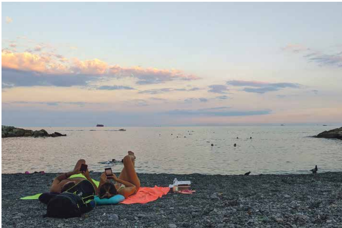
Selbst in den Pärchen-Ferien ist es immer dabei: Psycholog*innen raten Studierenden, ihr Handy öfter wegzulegen.