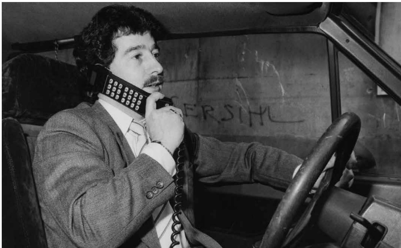
Handy am Steuer war noch nicht verpönt: Das erste «Nationale Autotelefon» erschien 1978 und wog 15 Kilogramm.