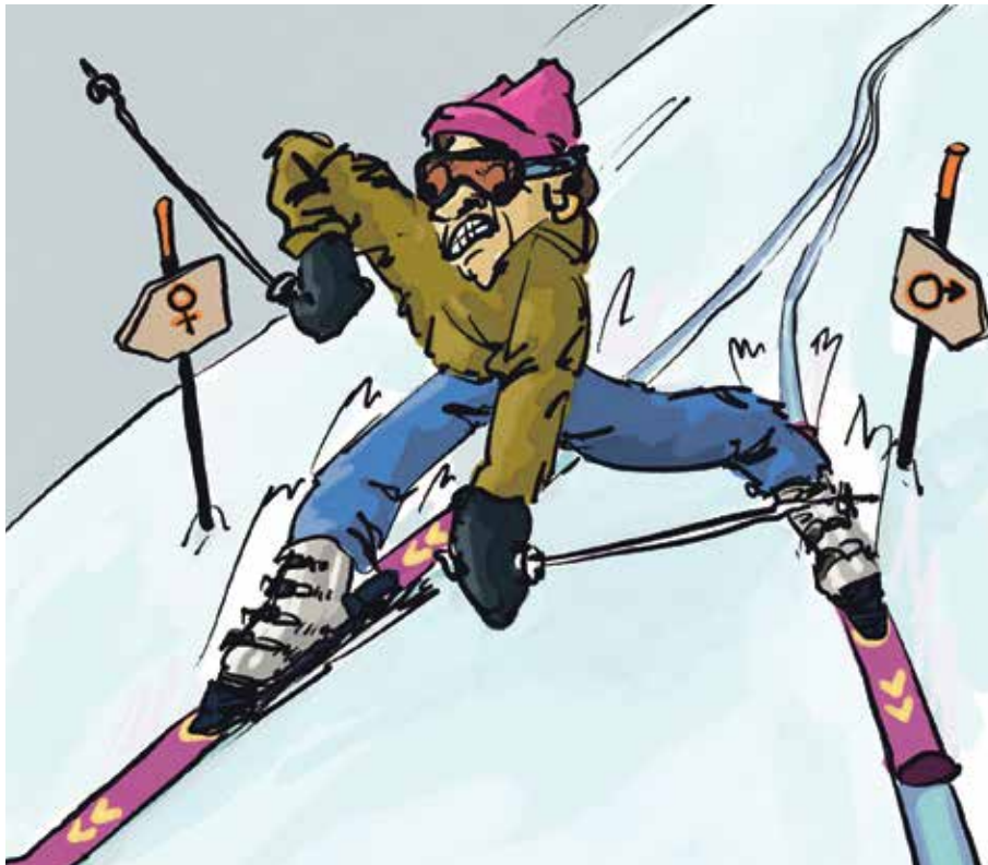
Studis können bei der Uni-Einschreibung nur «männlich» oder «weiblich» anklicken.