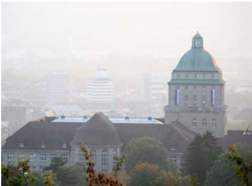
Mehr Transparenz: Die Uni legt Interessenbindungen offen.