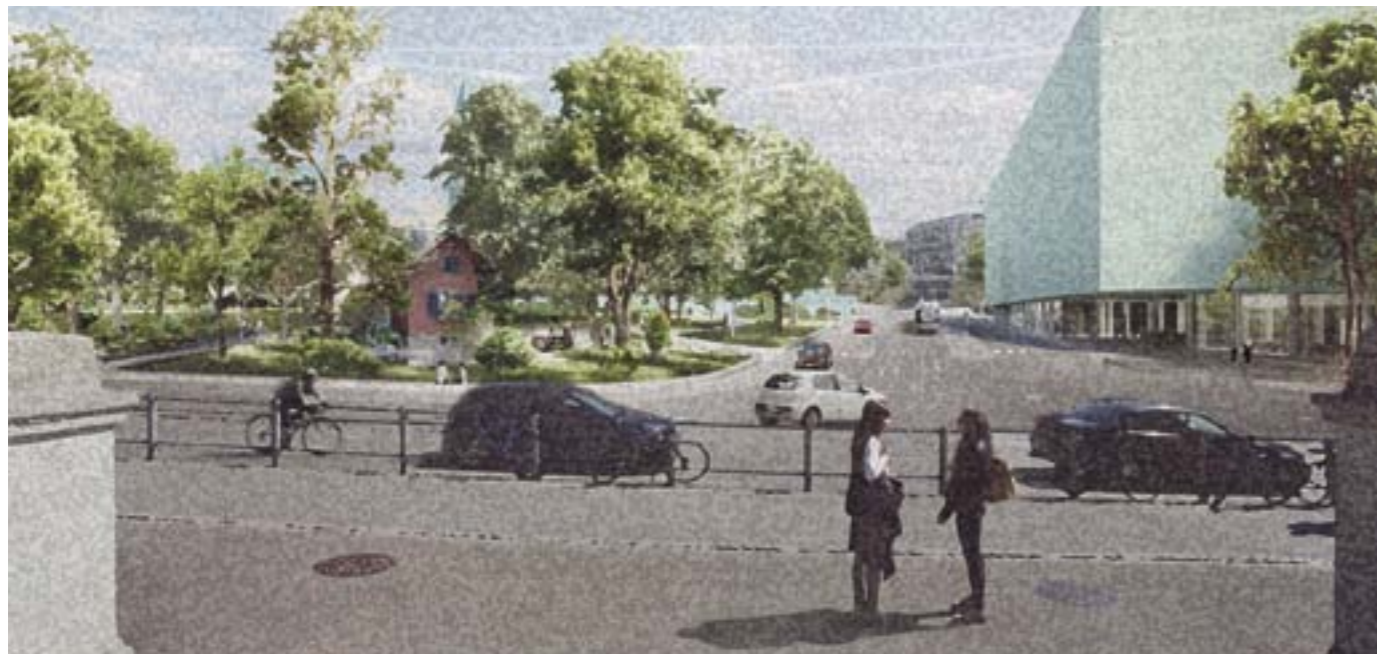
Bonsai-Büro-Feeling an der Affolternstrasse.