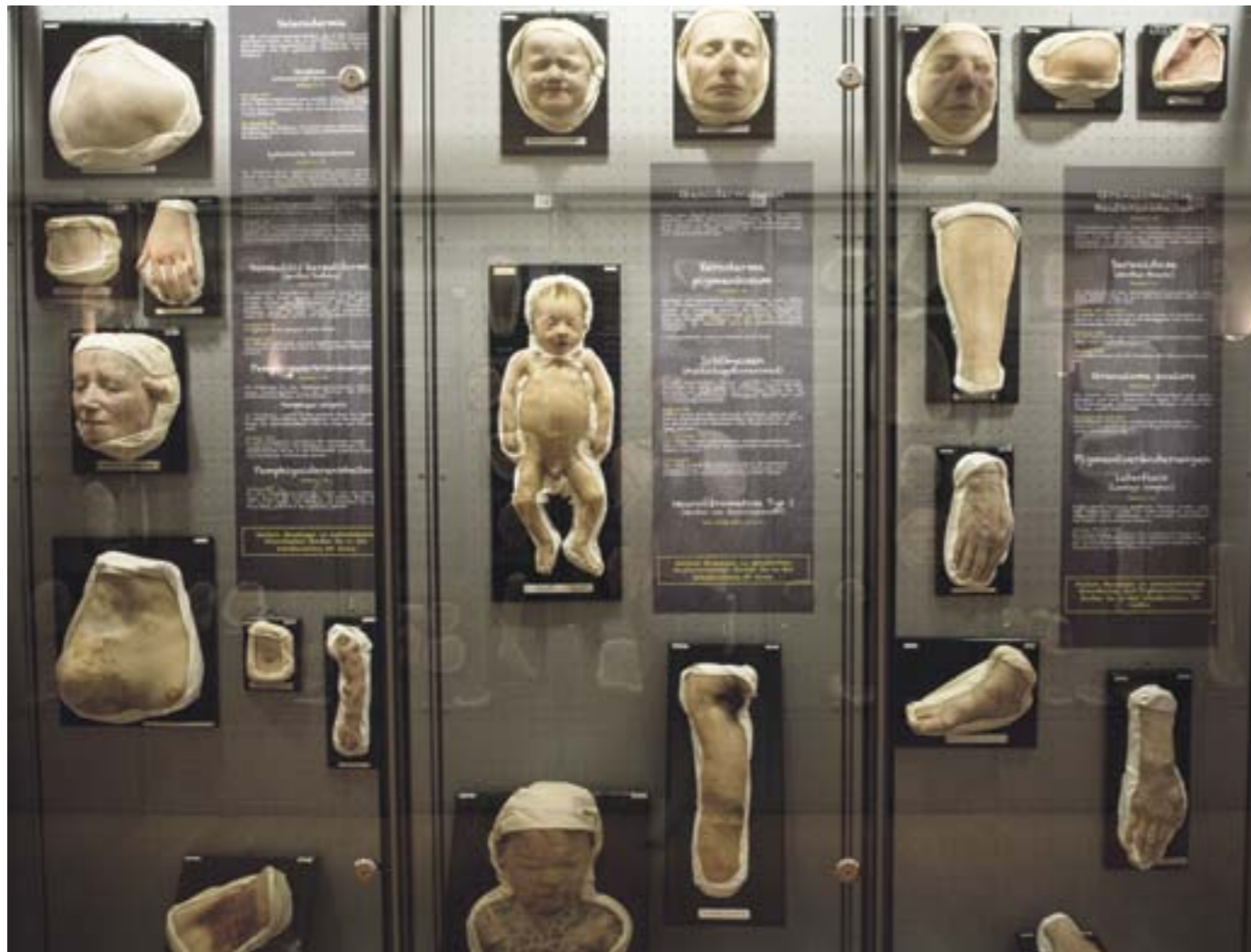
Nichts für Zartbesaitete: Die lebensechten Nachbildungen im Moulagenmuseum.