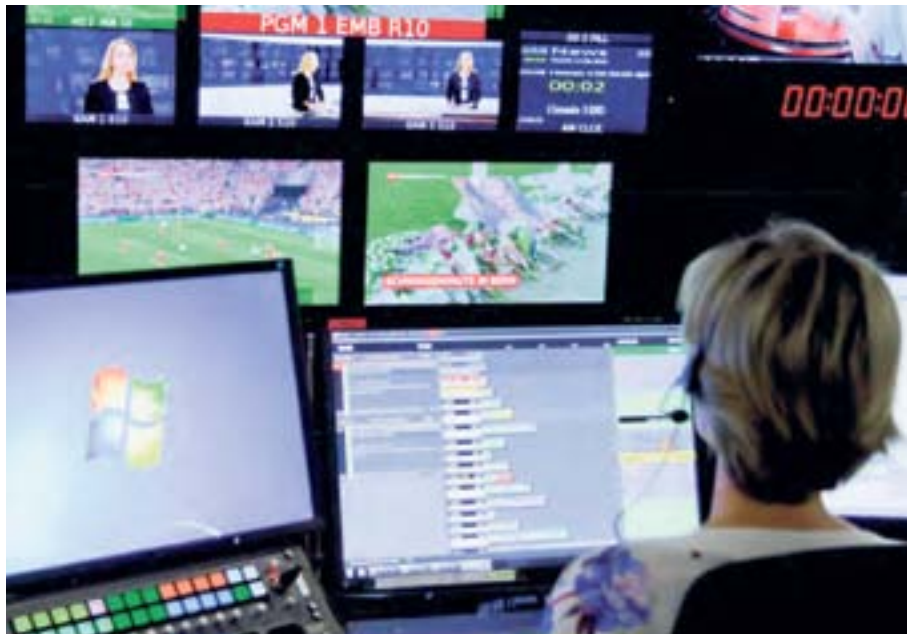
Frau am Hebel: Hinter den Kulissen bei der «Tagesschau».

Die Eidgenössische Kommission für Frauenfragen (EKF) gab 1978 zum ersten Mal die «Zeitschrift für Frauenfragen» heraus, um ihre Auswertungen, Beobachtungen und Resultate publizieren zu können. Nur zwei Jahre zuvor war die EKF vom Schweizer Bundesrat ins Leben gerufen worden, um sich in erster Linie mit Fragen der Gleichstellung beider Geschlechter zu befassen. Bemerkenswert ist, dass dies sogar noch vor dem Gleichstellungsgesetz im Jahr 1996 geschah.